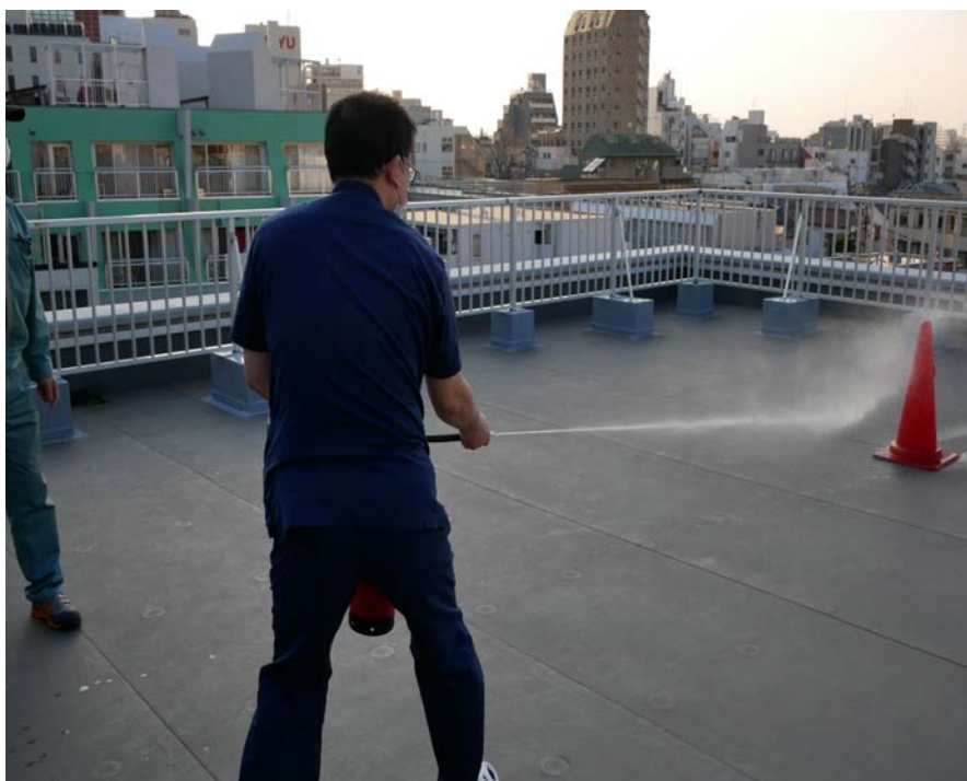
図 3. 消火器の使用訓練

避難場所も確認し、日本透析医会災害時情報ネットワークならびに東京都区部災害時医療ネットワークへの状況報告方法の確認も行った。アクションカードについては震度 6 の地震を想定し机上での訓練を行った（図 4）。