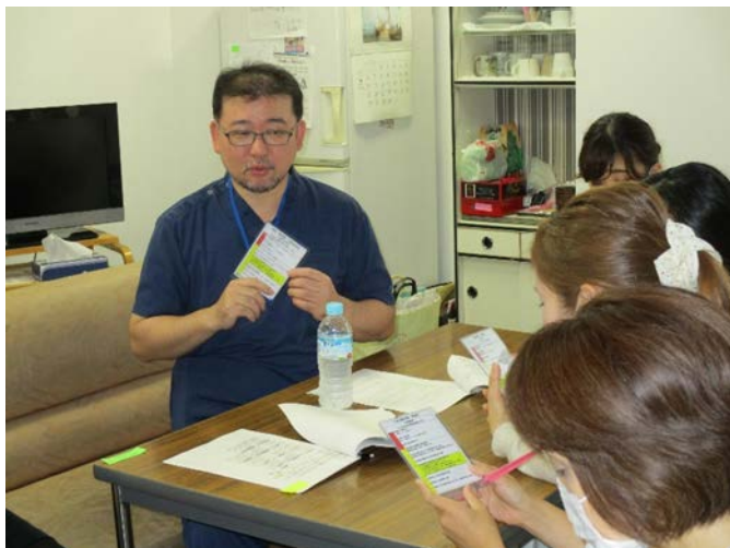
図 4. アクションカードを使った机上訓練

【考察・結論】 災害発生の規模だけでなく、発生時間や出勤職員の人数や経験年数、患者の状態などによって必要な対応は様々になると予測され、マニュアル化することは難しかった。だからこそ、日頃から意識的に行動し、患者とも災害について語れる場面を持ち指導できるよう、引き続き取り組んでいく必要がある。